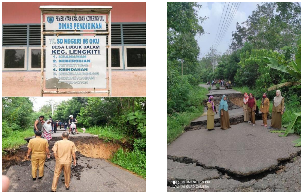
Gambar 1: Sekolah dan Kondisi Jalan Menuju Sekolah

Mitra sasaran kegiatan pengabdian adalah SD Negeri 86 Oku. SD Negeri 86 Oku terletak di Jl. Lintas Baturaja-Muaradua Km. 30, Lubuk Dalam, Kec. Lengkiti, Kab. Ogan Komering Ulu Prov. Sumatera Selatan. Sd negeri 86 Oku sendiri merupakan sekolah dasar yang termasuk dalam sekolah dalam cakupan 3 T (Tertinggal, Terdepan, dan Terluar) berikut adalah gambar sekolah dan kondisi jalan menuju sekolah: