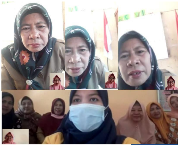
Gambar 1: Kegiatan Survey Awal

Langkah selanjutnya dilakukan survei lapangan yang bertujuan untuk mengamati situasi dan keadaan tempat yang direncanakan sebagai objek sasaran. Dikarenakan sedang pandemi COVID 19 dan pemberlakuan social distancing maka kegiatan ini dilaksanakan melalui daring menggunakan Whatsapp .