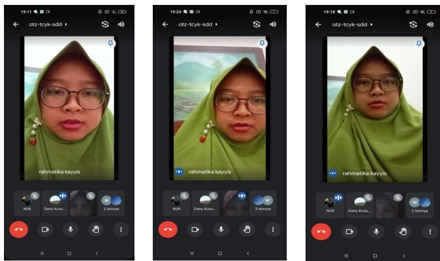
Gambar II. Pelaksanaan Pendampingan untuk sekolah SD N 86 OKU

mutu baik dari segi mutu lulusan, mutu proses pembelajaran, mutu guru, dan manajemen sekolah. Peserta yang telah diberikan materi kemudian langsung bisa mengadakan tanya jawab tentang hal yang belum dimengerti kepada tim PKM. Kegiatan ini akan dibimbing oleh pelaksana PKM. Pelatihan ini diharapkan dapat dilakukan secara komprehensif dan kontinyu guna memastikan bahwa sekolah benar-benar paham dan menguasai materi. Karena antusias maka beberapa pertanyaan disampaikan lewat Whatsapp dan dijawab dengan pemberian materi. Berikut ini dokumentasi pengabdian di SD Negeri 86 Oku: