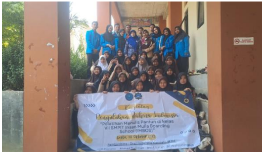
Gambar 5 Foto bersama Siswa-Siswi kelas VII SMPIT Insan Mulia Boarding School (IMBOS)