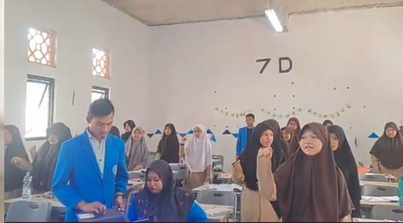
Gambar 2 pembelajaran pantun bersama siswa dan Tim dari prodi Pbsi Fkip Umpri