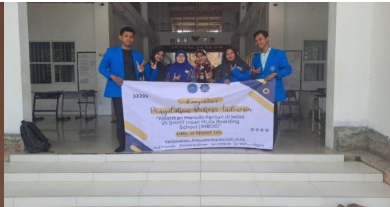
Gambar 6 Foto tim PKM dengan guru Mata Pelajaran Bahasa Indonesia

Kendala yang ditemui selama kegiatan pelatihan tersebut, masih terdapat siswa yang mengalami kesulitan dalam menyusun kalimat dalam baris pantun baik dari segi ciri ciri maupun struktur pantun. Siswa dalam mengerjakan menulis pantun baru didominasi oleh siswa yang sudah mempunyai pengetahuan dalam menulis pantun. Sebagian siswa yang lain masih belum memahami dan menguasai menulis pantun karena belum aktif mengikuti pembelajaran yang disampaikan oleh guru yang memerlukan media lagu agar termotivasi untuk belajar menulis pantun dengan suasana yang menyenangkan.