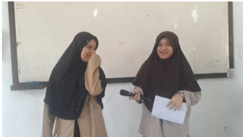
Gambar 3 Siswa praktik membaca pantun yang ditulis oleh siswa tersebut.