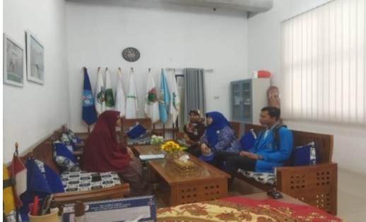
Gambar 1 wawancara bersama wakil kepala sekolah dan guru bahasa Indonesia

Berkut data dokumentasi kegiatan pengabdian masyarakat Siswa- Siswi VII SMPIT Insan Mulia Boarding School (IMBOS).