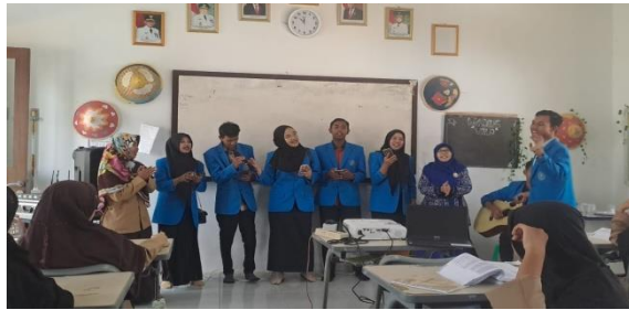
Gambar 4 Pembelajaran pantun melalui media lagu