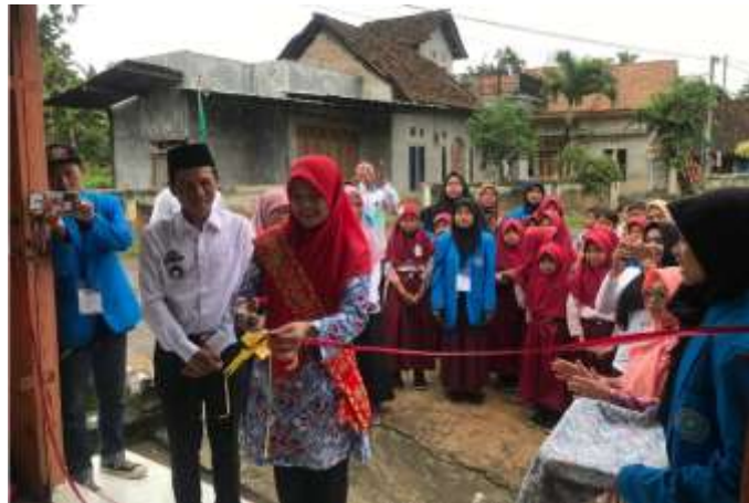
Gambar. 1 Peresmian Rumah Literasi Oleh Bunda Literasi Pekon Argopeni

Kegiatan ini dilaksanakan pada tanggal 2 Maret 2024, di Pekon Argopeni Kecamatan Sumberejo Kabupaten Tanggamus provinsi Lampung. Pengabdian masyarakat ini mempunyai tema Peran Literasi sebagai Pondasi Generasi Emas dilakukan Tim Mahasiswa, Dosen, dan aparatur pemerintahan Pekon Argopeni yang berperan sebagai penyelenggara juga peserta kegiatan.