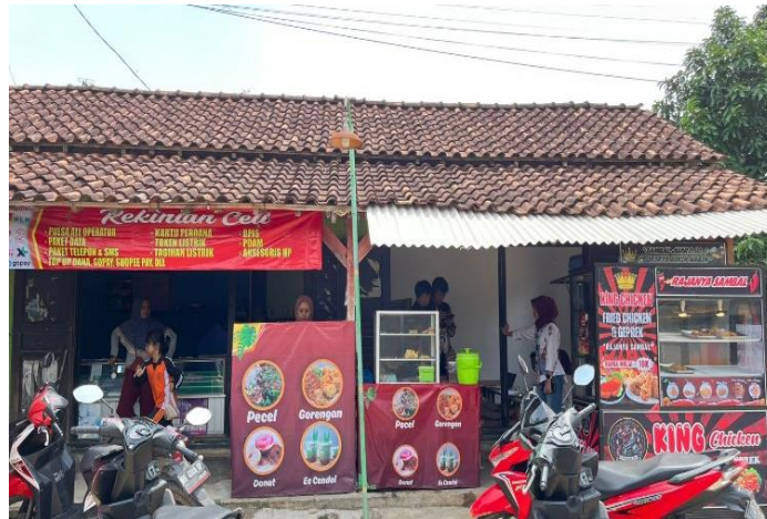
Gambar 3. Tahap Pendampingan Sertifikat Halal

Pendampingan dilakukan secara individual untuk memastikan setiap pelaku usaha mampu memahami dokumen dan prosedur yang diperlukan dalam proses pengajuan sertifikasi halal.