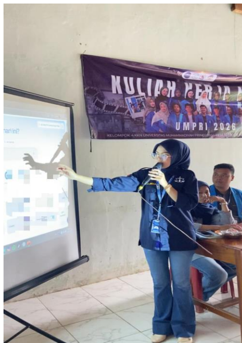
Gambar 1. Sosialisasi Program Pengabdian Masyarakat

Kegiatan sosialisasi dilaksanakan secara tatap muka dengan pendekatan partisipatif yang memungkinkan peserta berinteraksi langsung dengan narasumber. Dokumentasi kegiatan sosialisasi ditunjukkan pada Gambar 1.