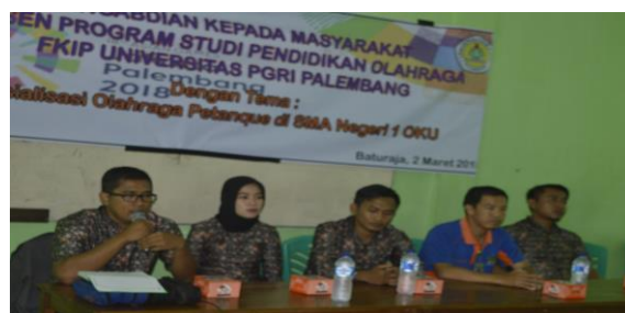
Gambar 1. Pembukaan Materi Petanque

Pada inti dari kegiatan ini, siswa diberikan pengarahan mengenai olahraga petanque oleh salah satu pemateri. Pemateri memaparkan pengetahuan yang dimulai dari sejarah petanque, bagaimana cara membuat lapangan petanque, jenis-jenis bola petanque, peraturan permainan dan teknik lemparan. Pada tahap ini, siswa diminta untuk memperhatikan dengan cermat mengenai pemaparan yang disampaikan oleh pemateri. Siswa diberikan kopi materi berupa lembaran kertas yang dipaparkan pada kegiatan ini agar memberikan kemudahan untuk siswa dalam menyimak pemateri.