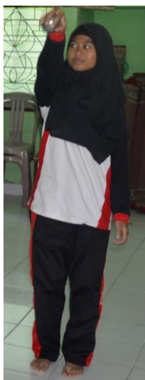
Gambar 5. Fase Utama

rata-rata bahu. Bola dapat dilepaskan pada saat berada di puncak tangan tertinggi. Lemparan diarahkan pada sasaran bola kayu. Bola kayu adalah pusat sasaran bola besi yang akan dilemparkan. Pada permainan ini, poin akan didapatkan apabila bola besi yang dilemparkan lebih dekat dengan bola kayu. Lemparan dilakukan oleh pemain secara bergantian dengan bola besi masing-masing ke arah satu pusat sasaran yang sama. Pemenang pada permainan ini adalah pemain yang dapat mendekati bola kayu dengan jarak yang paling dekat. Pada permainan ini, bola besi diperbolehkan mengenai bola kayu.