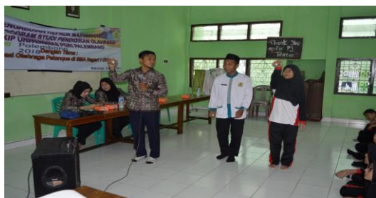
Gambar 2. Praktik Melempar Bola Petanque

Pada tahapan selanjutnya di kegiatan ini, siswa diberi kesempatan untuk melihat, mengamati dan mempraktikkan bagaimana cara memegang bola. Siswa diberi pengetahuan bagaimana cara memegang bola besi dan bola kayu. Pada praktik memegang bola besi dan bola kayu tentu memiliki perbedaan karena berat dari jenis bola yang berbeda. Hal ini akan mempengaruhi bagaimana cara melempar dan mengukur kekuatan dalam melempar bola dalam membidik sasaran.