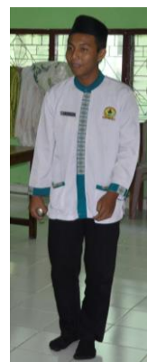
Gambar 4. Fase Awal Permainan Petanque

Selain itu, siswa juga diberi pengarahan bagaimana fase-fase dalam permainan petanque. Fase pada permainan ini dimulai dengan fase awal. Posisi ini, siswa diminta untuk mengikuti sikap sempurna dalam memulai permainan. Siswa juga diberi pengarahan bagaimana cara memegang bola yang benar pada fase awal. Bola yang dipakai pada fase ini merupakan bola besi.