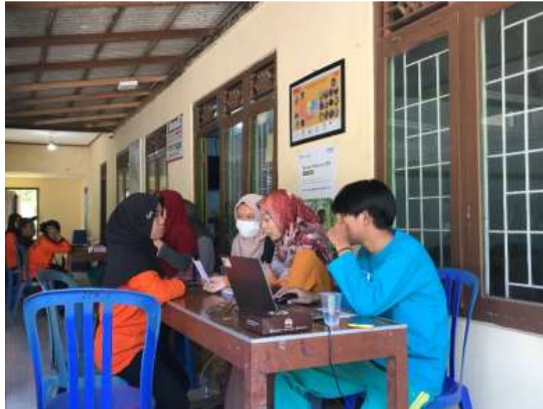
Gambar 5. Konsultasi hasil cek kesehatan

Pos ketiga adalah pos konsultasi, di mana para peserta yang telah selesai melakukan cek kesehatan bisa berkonsultasi terkait hasil pemeriksaan mereka. Pada pos ini, peserta diberikan penjelasan lebih rinci mengenai hasil cek kesehatan yang mereka peroleh. Konsultasi ini mencakup saran dan rekomendasi dari tenaga medis mengenai langkah-langkah yang harus diambil untuk menjaga atau memperbaiki kondisi kesehatan mereka. Misalnya, peserta dengan kolesterol tinggi disarankan untuk mengurangi konsumsi makanan berlemak dan meningkatkan aktivitas fisik. Sementara itu, peserta dengan kadar gula darah tinggi diberikan anjuran untuk mengatur pola makan yang lebih sehat dan menghindari makanan dengan kandungan gula tinggi.