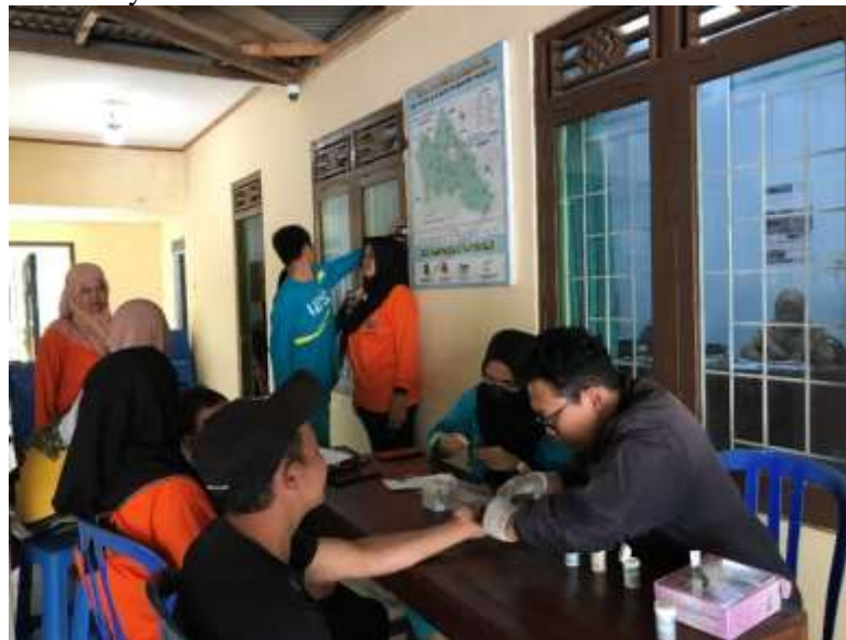
Gambar 4. Pengecekan gula darah

Untuk memastikan kelancaran dan efisiensi dalam proses cek kesehatan, kegiatan ini dibagi menjadi tiga pos. Pos pertama adalah pos daftar hadir, di mana seluruh peserta yang mengikuti kegiatan diwajibkan untuk mengisi daftar hadir sebagai bukti kehadiran dan untuk mencatat identitas peserta. Pos ini juga berfungsi untuk mengatur alur peserta agar dapat dilayani dengan tertib di pos-pos berikutnya.