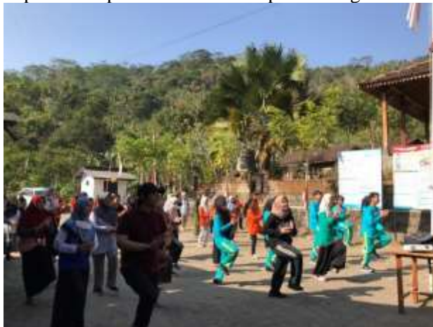
Gambar 2. Kegiatan senam sehat bersama

Senam sehat ini dirancang dengan gerakan-gerakan yang sederhana namun efektif untuk menjaga kesehatan jantung, melancarkan peredaran darah, serta meningkatkan fleksibilitas dan kekuatan otot. Instruktur senam yang berpengalaman memimpin kegiatan ini, memastikan setiap peserta dapat mengikuti gerakan dengan benar dan sesuai dengan kemampuan masing-masing. Selain itu, musik energik yang mengiringi senam menciptakan suasana yang menyenangkan dan penuh semangat, sehingga para peserta dapat menikmati setiap sesi dengan antusiasme.